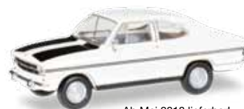
Ab Mai 2018 lieferbar! Delivery in May 2018! H0 1/87

020817-005 11,95 € Citroën 2 CV Charleston, hellgrau / dunkelgrau / Citroën 2 CV Charleston, light gray / dark gray