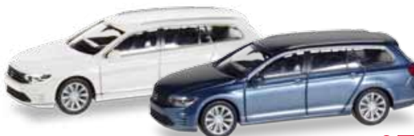
F H0 1/87

028929 Porsche 911 Turbo Cabriolet, indischrot / indian red 13,95 € 038928 Porsche 911 Turbo Cabriolet, tiefschwarzmetallisch / deep black metallic 14,95 € Formneuheit! Ein Porsche in seiner schönsten Form, so wird der Turbo oft bezeichnet. Bei Herpa gibt es diese Motorisierung mit der markanten Heckpartie nun auch als Cabriolet in indischrot und tiefschwarzmetallisch. / New type! The Turbo is often considered as Porsche in its most beautiful form. Herpa releases this version with the striking rear end also as convertible in Indian red and jet-black metallic.