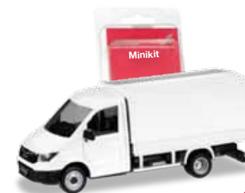
F H0 1/87

093712 18,95 € MAN TGE Einfachkabine mit Pritsche und Plane, rot / single cabin with platform and canvas, red 013451 10,95 € Minikit MAN TGE Einfachkabine mit Pritsche und Plane, weiß / Minikit MAN TGE single cabin with platform and canvas, white Formneuheit! Die neue MAN TGE Kabine, kombiniert mit einem Pritschenaufbau mit Plane, basiert auf dem neuen Fahrgestell von Herpa mit Zwillingsbereifung. Zur freien Gestaltung bietet Herpa den neuen MAN TGE als Planenfahrzeug auch als Bausatz in weißer Farbgebung an. / New type! The new MAN TGE cab, combined with a flatbed superstructure with canvas cover is based on Herpa's new chassis with dual tires. Herpa also offers the new MAN TGE as canvas cover vehicle also as kit in white for individual designs.