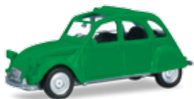
Ab April 2018 lieferbar! Delivery in April 2018! H0 1/87

020824-005 11,95 € Citroën 2 CV offen, verkehrsgrün / Citroën 2 CV with folding top open, traffic green