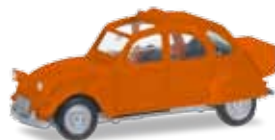
Ab Mai 2018 lieferbar! Delivery in May 2018! H0 1/87

020824-005 11,95 € Citroën 2 CV offen, verkehrsgrün / Citroën 2 CV with folding top open, traffic green