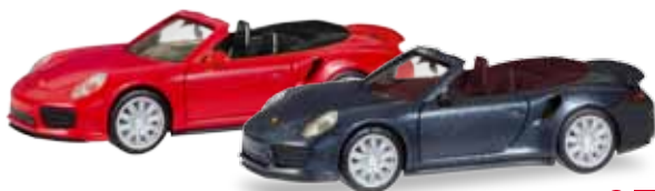
F H0 1/87

028738-002 16,95 € VW T6 Multivan, kirschrot / cherry red