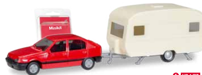
F H0 1/87

028981 VW Passat Variant GTE E-Hybrid, pure white 13,95 € 038980 VW Passat Variant GTE E-Hybrid, havardblue metallic 14,95 € Formneuheit! Die ersten 50 Kilometer fährt der GTE mit Elektroantrieb, danach sprintet ein 218 PS starker Benzinmotor. Was unter der Haube steckt, ist äußerlich nur an der geänderten Frontpartie zu sehen, die Herpa originalgetreu abbildet. / New type! The first 50 kilometers, the GTE drives with electric drive, after that it sprints with a 218 HP petrol engine. What's underneath the hood can only be distinguished by the modified front part which Herpa realized authentically.