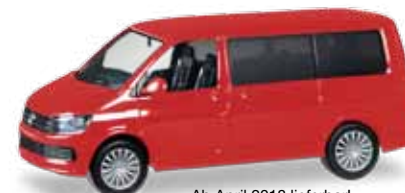
Ab April 2018 lieferbar! Delivery in April 2018! H0 1/87

024914-003 11,95 € Opel Kadett B Coupé Rallye, weiß, schwarz / white, black