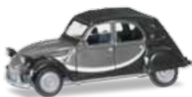
Ab Mai 2018 lieferbar! Delivery in May 2018! H0 1/87

027632-004 11,95 € Citroën 2 CV mit Queue, orange / Citroën 2 CV with queue, orange