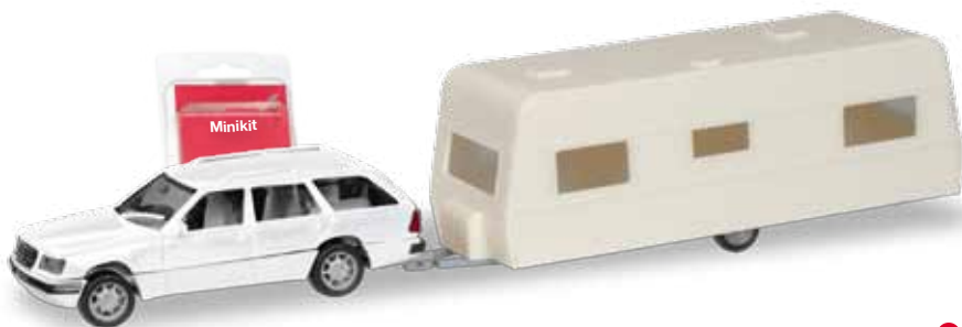
F H0 1/87

013420 19,95 € Minikit Opel Kadett E GLS mit Wohnanhänger Minikit Opel Kadett E GLS with caravan Auch der Opel Kadett E kommt bei Herpa als Minikit in Verbindung mit einem kleineren Wohnwagen erneut zu Ehren. Der rote Viertürer lässt sich problemlos montieren, bei dem kleineren Wohnwagen ist Plastik-Kleber hilfreich. / Herpa honors the Opel Kadett E as Minikit with a smaller camper. The red four-door can easily be mounted with plug-in technology, for the camper trailer, some plastic glue is recommended.