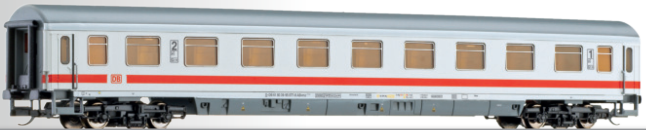
Reisezugwagen 1./2. Klasse ABvmz 111.2 der DB AG 1st/2nd class passenger coach ABvmz 111.2 of the DB AG