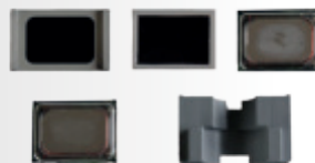
Abbildung zeigt 66051

Soundbaustein E 94 Sound module class 94