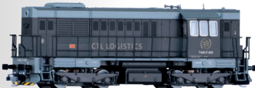
Diesellokomotive Reihe T448p der CTL Logistics (PL) Diesel locomotive class T448p of the CTL Logistics (PL)