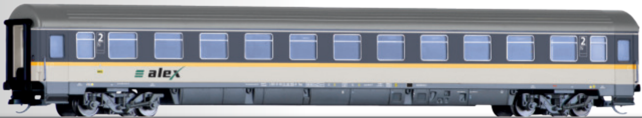
Reisezugwagen 2. Klasse Bmz „alex“ der DLB GmbH 2nd class passenger coach Bmz „alex“ of the DLB GmbH