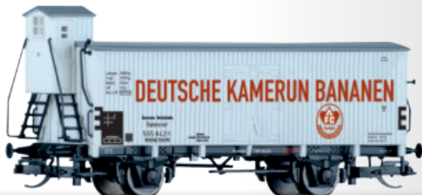
Kühlwagen „Deutsche Kamerun-Bananen“, eingestellt bei der DRG Refrigerator car „Deutsche Kamerun-Bananen“ of the DRG