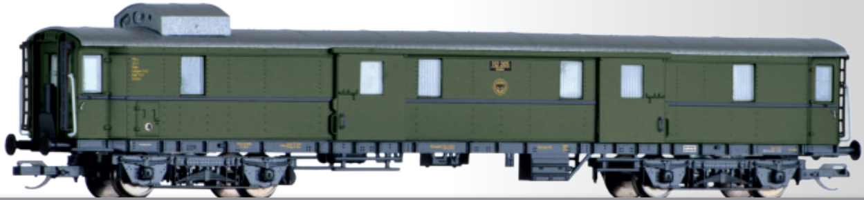
Gepäckwagen Pw4i der DRG Baggage car Pw4i of the DRG