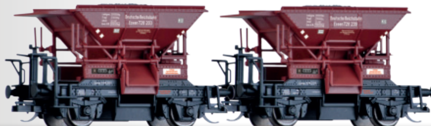
Güterwagenset der DRG, bestehend aus zwei Schotterwagen Freight car set of the DRG with two hopper cars