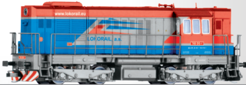
Diesellokomotive Reihe 740 der Lokorail a.s. (SK) Diesel locomotive class 740 of the Lokorail a.s. (SK)