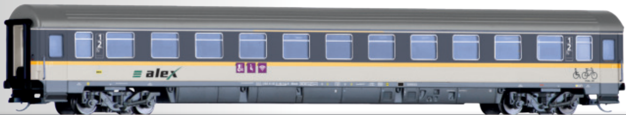
Reisezugwagen 1./2. Klasse ABbmdz „alex“ der DLB GmbH 1st/2nd class passenger coach ABbmdz „alex“ of the DLB GmbH