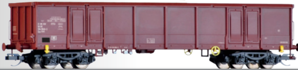
Offener Güterwagen Eas 5948 der DR Open Car Eas 5948 of the DR