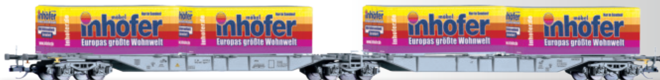
Doppeltragwagen Sggmrs 104 der AAE, beladen mit 4 Wechselkoffern „Inhofer“ Container car Sggmrs 104 of the AAE, with load