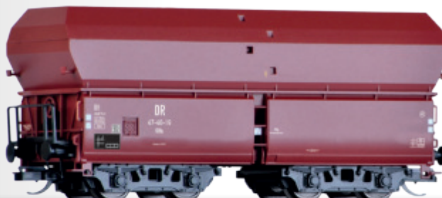
Selbstentladewagen OOtU der DR Hopper car OOtU of the DR