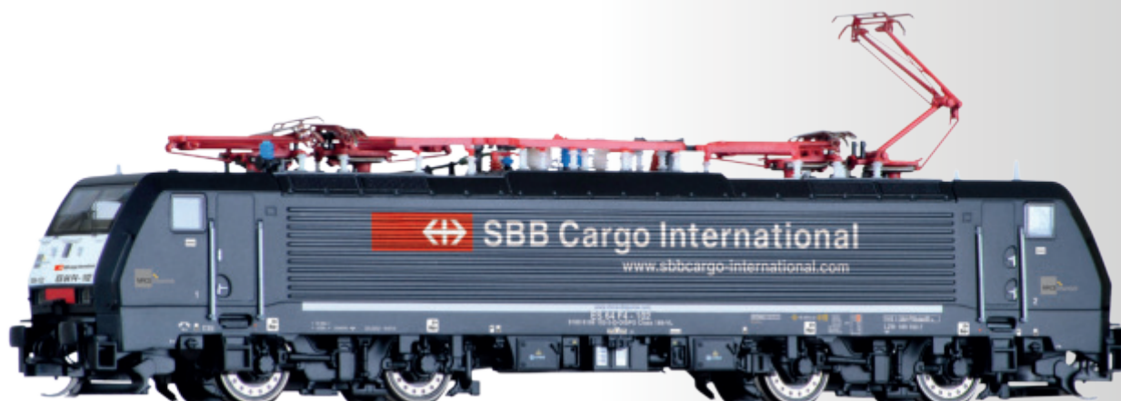
Elektr.lokomotive BR 189 der MRCE / SBB Cargo International Electric locomotive class 189 of the MRCE / SBB Cargo International