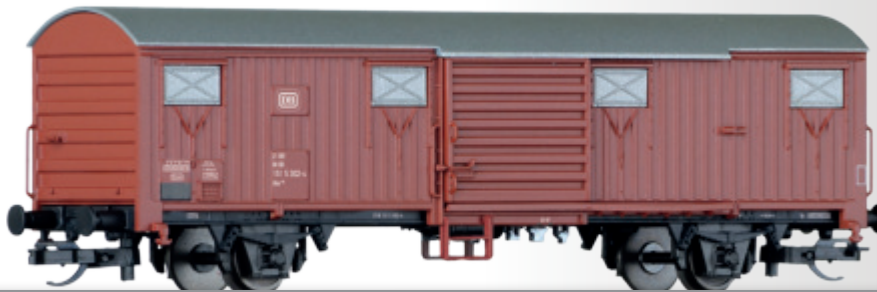
Gedeckter Güterwagen Gbs 256 der DB Box car Gbs 256 of the DB