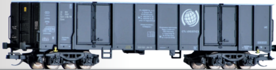
Güterwagenset der CTL Logistics (PL), bestehend aus zwei offenen Güterwagen Eaos Freight car set of the CTL Logistics (PL) with two open cars Eaos