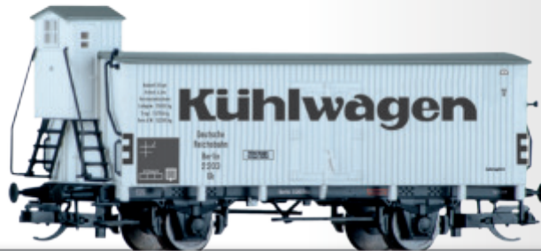
Kühlwagen Gk Berlin der DRG Refrigerator car Gk Berlin of the DRG