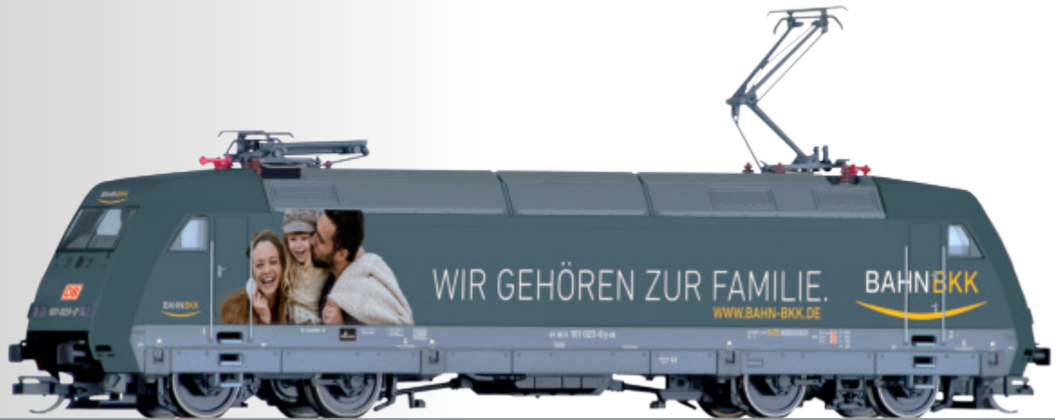
Elektr locomotive 101 023-0 „Bahn BKK“ der DB AG Electric locomotive 101 023-0 „Bahn BKK“ of the DB AG