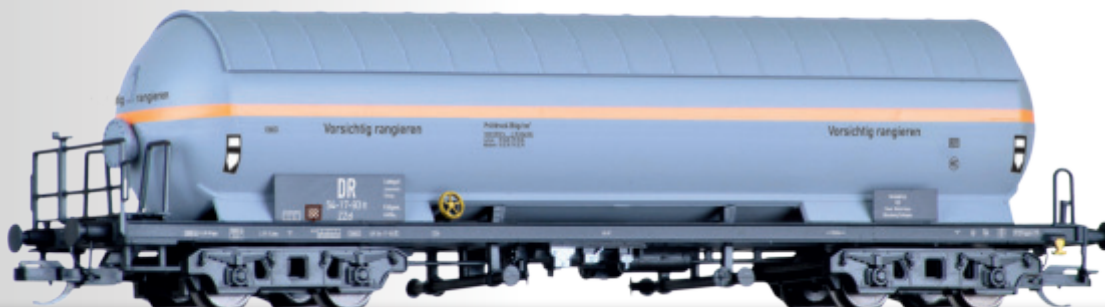
Gaskesselwagen der DR Gas tank car of the DR • Mit Sonnenschutzdach / With sunshield