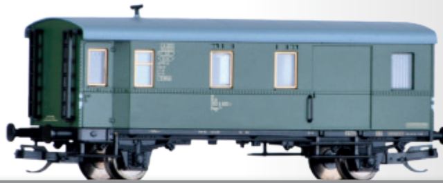
Güterzugpackwagen Pwgs 041 der DB Baggage car Pwgs 041 of the DB