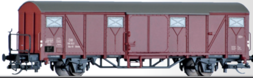
Gedeckter Güterwagen Glmms 61 der DB Box car Glmms 61 of the DB