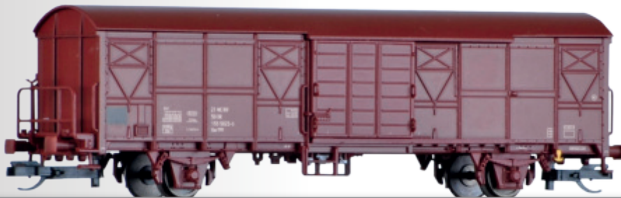
Gedeckter Güterwagen Gbs 1555 der DR Box car Gbs 1555 of the DR