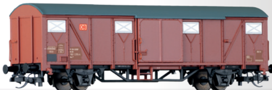
Gedeckter Güterwagen Gbs 254 der DB AG Box car Gbs 254 of the DB AG