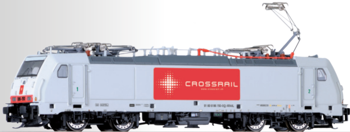
Elektr locomotive 186 150-9 der Crossrail Electric locomotive 186 150-9 of the Crossrail