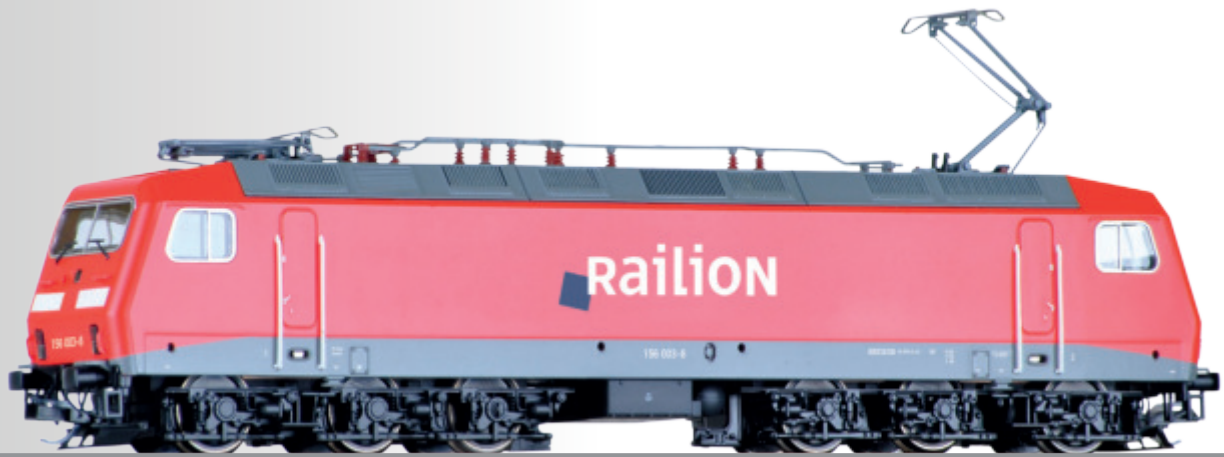
Elektr locomotive 156 003-6 „Railion“ der DB AG Electric locomotive 156 003-6 „Railion“ of the DB AG