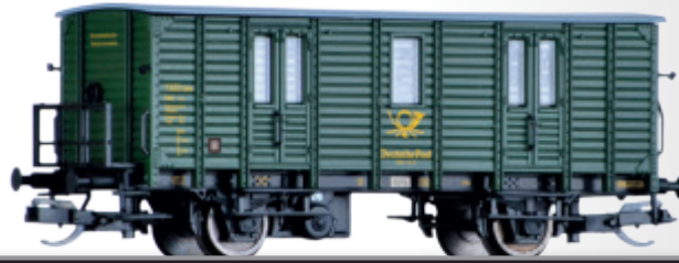
FORMNEUHEIT: Bahnpostwagen Post-p/8,5 der Deutschen Post NEW: Mail wagon Post-p/8,5 of the Deutschen Post