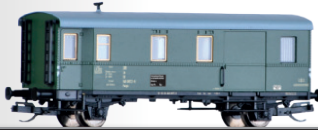
Güterzugpackwagen Pwgs der DR Baggage car Pwgs of the DR