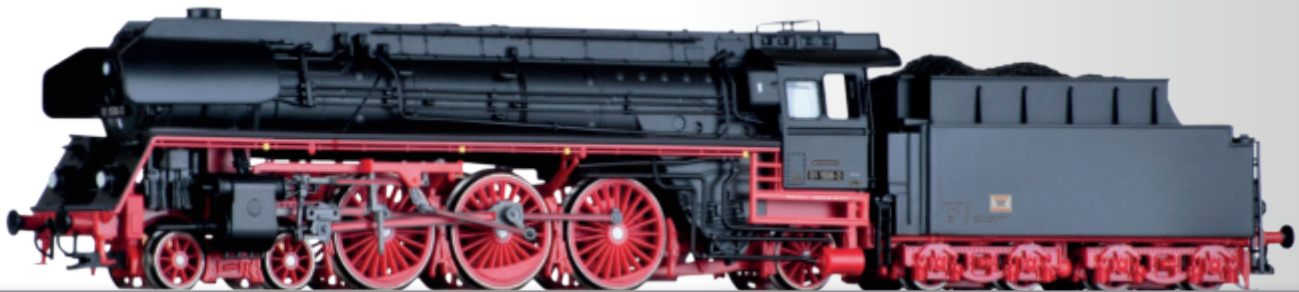
Dampflokomotive BR 01.5 der DR Steam locomotive class 01.5 of the DR