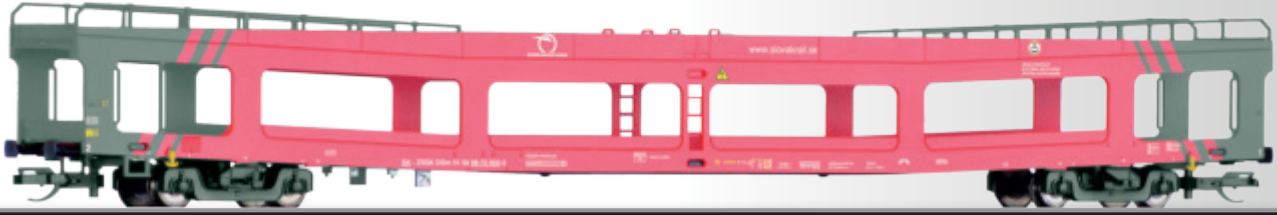
Autotransportwagen DDm der ZSSK Car for automobile transport DDm of the ZSSK