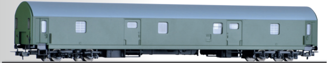
Abbildung zeigt unbedrucktes H0-Muster

Auslieferung bereits Mitte 1. Quartal 2019