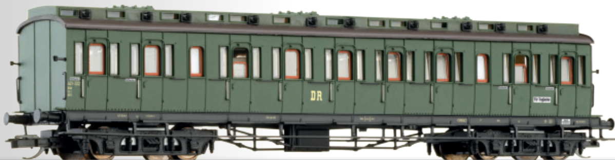
Reisezugwagen 2. Klasse mit Traglastenabteil der DR 2nd class passenger coach of the DR