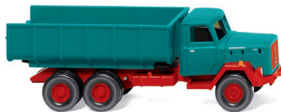
0645 03 Schuttwagen (Magirus) UVP 13,99 €