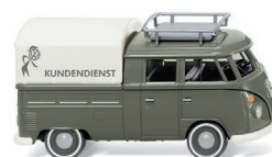
0789 05 VW T1 Doppelkabine UVP 15,99 €