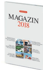
0006 25 WIKING-MAGAZIN 2018 UVP 11,00 €

Der legendäre italienische Roadster hat sein WIKING-Denkmal erhalten! Beim Alfa Spider, aus der Feder des Kultdesigners Pininfarina, hat sich WIKING bei der Konstruktion des italienischen Klassikers ganz bewusst der neuen Formensprache verschrieben – die Details sind filigran nachgebildet. Außerdem stellen die Traditionsmodellbauer den BMW 2002 im Dienst des Freistaates vor, der nach zeitgenössischem Vorbild der bayerischen Polizei gestaltet ist. Darüber hinaus debütieren der Mercedes-Benz LP 2223 als Hochbordpritschen-Lkw