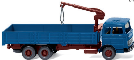
0433 07 Hochbordpritschen-Lkw (MB LP 2223) UVP 14,99 €