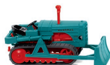
0844 37 Hanomag K55 Raupenschlepper UVP 10,99 €