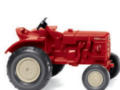
0877 05 Fahr Schlepper UVP 8,49 €