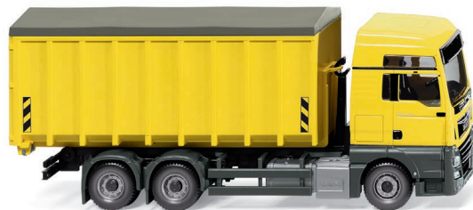
0672 05 Abrollcontainer (MAN TGX EURO 6c/Meiller) UVP 28,99 €