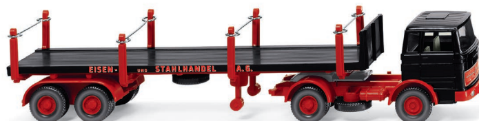
0518 45 Rungensattelzug (MB 1620) UVP 19,99 €