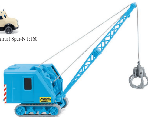
0661 49 Raupenkran (Krupp Ardel) UVP 15,99 €