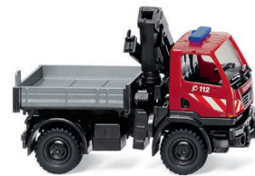
0601 31 Feuerwehr – Unimog U 20 mit Ladekran UVP 19,99 €