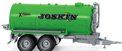
0382 38 Joskin Vakuumfasswagen UVP 11,99 €