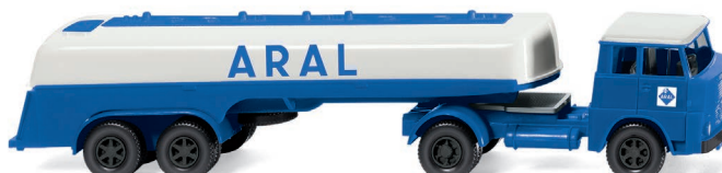
0806 98 Tanksattelzug (Henschel HS 14/16) UVP 19,99 €