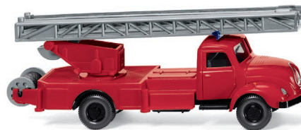
0620 02 Feuerwehr – Drehleiter (Magirus S 3500) UVP 13,99 €