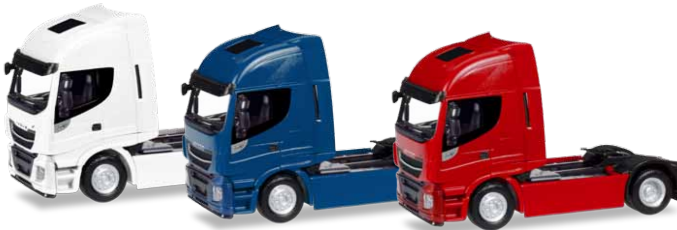
309141 Iveco Stralis Highway XP, weiß / white