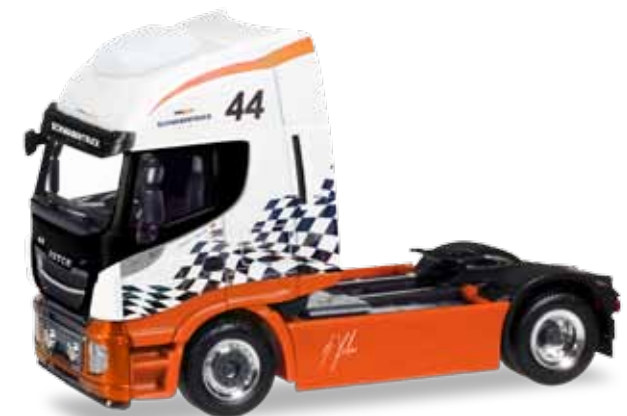
F HO 1/87

Sein Debüt feierte der nagelneue Stralis XP in den Neuheiten September/Oktober 2018 als das diesjährige aufwändig bedruckte und verzierte Weihnachtsmodell. Ganz klar, wir wollen unsere Sammler und Modellbauer die Möglichkeit bieten, diese neuen Modelle schnell für eigene Wünsche und Umbauten zu Verfügung zu stellen. Dies tun wir mit Varianten in Weiß, Rot und Blau. Als unlimitiertes Modell wird die zum Umbauen gut geeignete weiße Variante längerfristig im Programm bleiben. / The brand-new Stralis XP celebrated its debut with the new releases September / October 2018 as this year's elaborately printed and decorated Christmas model. Of course we want to offer our collectors and model builders the opportunity to swiftly get this model for own designs and conversions. We do so with variants in white, red and blue. The white variant, well suited for conversions, will remain in the range as unlimited model for the long term.