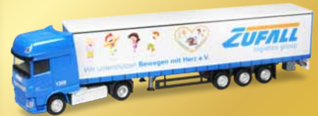
DAF XF SSC Euro 6 Gardinenplanen-Sattelzug DAF XF SSC Euro 6 curtain canvas semitrailer „Zufall - Bewegen mit Herz e.V.“

! Dieses limitierte Modell gibt es nicht im Handel. Es ist nur über eine Mitgliedschaft im Cars-Club erhältlich. This limited-edition model is not available in the stores. It is only available through a Herpa Cars Club membership.