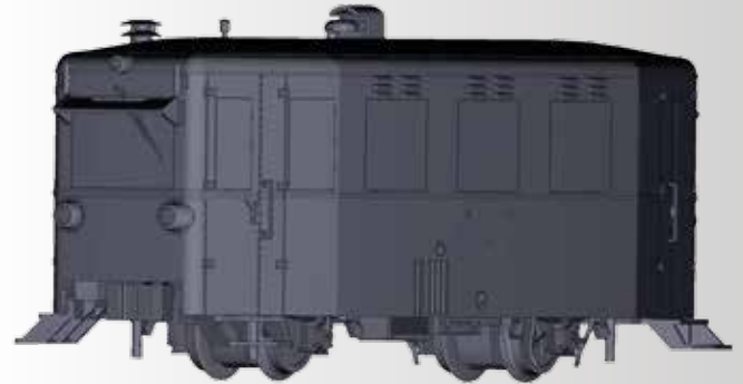
Arbeitsstand November 2017

FORMNEUHEIT: Triebwagen T1 der MEG (Mittelbadische Eisenbahn-Gesellschaft) NEW: Rail car T1 of the MEG (Mittelbadische Eisenbahn-Gesellschaft)