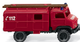
0601 29 Feuerwehr – Unimog S UVP 14,99 €