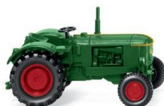
0881 03 Deutz D 40 L UVP 7,99 €