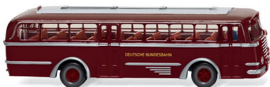
0720 02 Büssing Trambus UVP 21,99 €