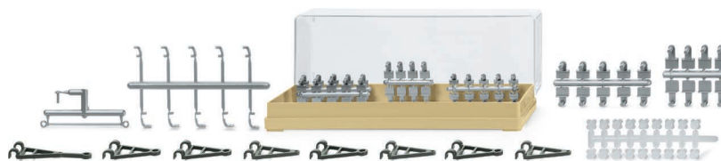
0018 18 Zubehörpackung – Verbindungen II UVP 8,99 €