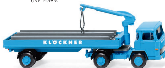
0502 05 Baustoffwagen (Magirus 135 D 11 FS) UVP 16,99 €

F acettenreicher Rückblick auf die große Zeit der WIKING-Klassiker! Aus alten Formen revitalisieren die Traditionsmodellbauer das sportliche Porsche 356 Cabrio, die elegante DKW-Limousine und den Unimog S als Feuerwehrlöschfahrzeug jener Zeit. Im authentischen Auftritt seiner Produktionszeit fährt zugleich der Ford Continental in Bicolor-Gestaltung ins Programm – gerade die Pastellfarbe des Wagenlacks bei gleichzeitig weiß abgesetztem Dach erinnert an die große Zeit der imposanten USA-Coupés. Fein veredelt erscheinen der VW T1 (Typ 2) im "Dujardin"-Markendesign und der große Deutz-Schlepper vom Typ