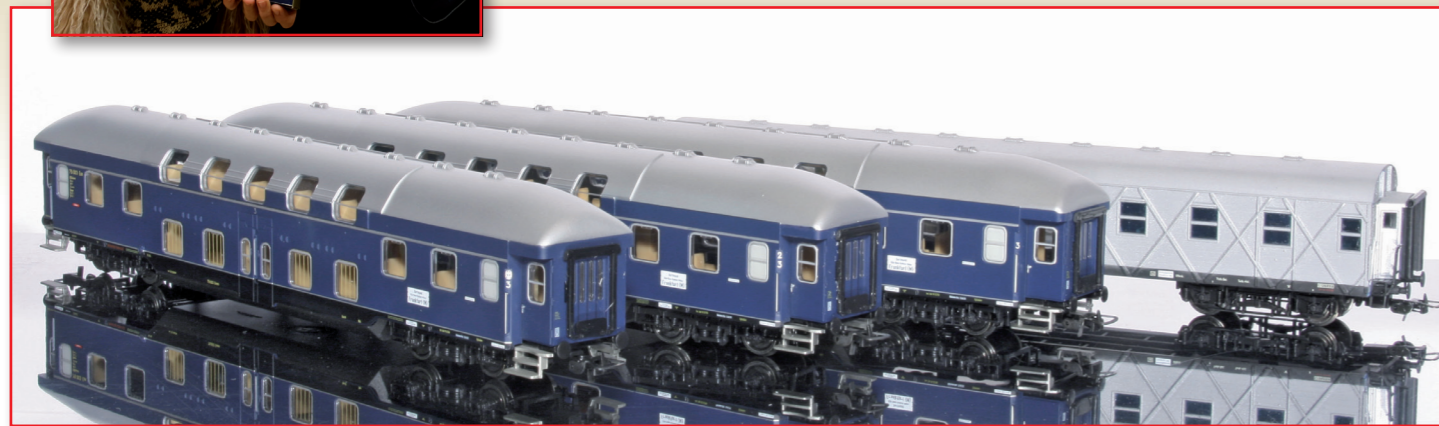
11222 - Geburtstagsset 20 Jahre HERIS

Vor zwanzig Jahren wurde der Grundstein für das HERIS-Programm gelegt, und daran will die neue Sonderedition der Blauen Doppelstockwagen, ergänzt um einen Gesellschaftswagen, erinnern. Es ist eine kleine Tradition bei HERIS geworden, dass zu den runden Geburtstagen ein solches Set herausgegeben wird.