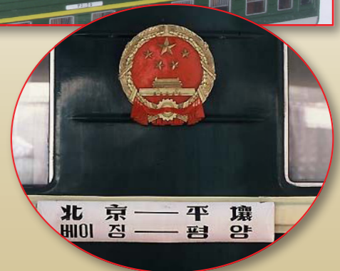
17066 - 2er Set Ammendorfer-Wagen gebaut für China, Epoche IV.

Der Waggonbau Ammendorf produzierte nicht nur für die Eisenbahn der Sowjetrepublik Reisezugwagen. Es erfolgten zum Beispiel auch Lieferungen in die Volksrepublik China. Auch wenn solche Fahrzeuge nur noch im Museum stehen, sind sie bei den Sammlern in China in guter Erinnerung. Nach dem Erfolg des Mongolischen Reisezugs, den HERIS erstmalig aus seinem Chinesischen Angebot ins Programm für Europa übernommen hatte, kommt nun als Neuheit 2019 ein Set zweier Wagen der Chinesischen Eisenbahn.