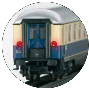
Vorbildgerecht mit Zugschluss-Signal