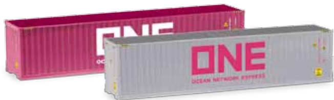
Ab September 2018 lieferbar! Delivery in September 2018! H0 1/87

076388-007 18,95 € Goldhofer Semitiefelader 5-achs, moosgrün / Goldhofer low boy trailer 5-axe, moss green