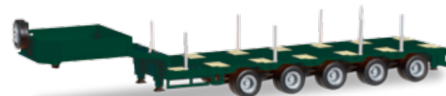
Ab September 2018 lieferbar! Delivery in September 2018! H0 1/87

076142-006 12,95 € Goldhofer TU4 Anhänger, hellrotorange / Goldhofer TU4 construction site trailer, light red orange